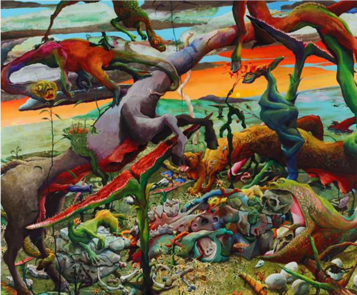
Arno Bojak, Sonnenuntergang , Doppelbelichtung 2011, Acryl/Nessel 240x290cm