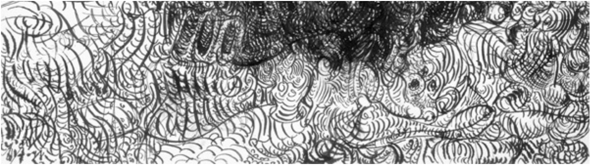
Frank Diersch, Discovery, 1998, Feder-Tusche auf Papier, 21x29 cm